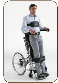
Αναπηρικά Αμαξίδια (ηλεκτρικά & χειροκίνητα) - Ορθοστάτες